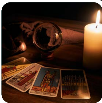
LA CARTOMANTE MAGICA

La Casa della Strega di Hansel e Gretel è pronta ad accogliere i visitatori, ma attenzione: solo i più coraggiosi riusciranno a trovare la via d'uscita!