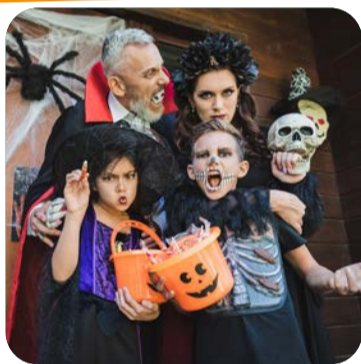
CASA "DOLCETTO O SCHERZETTO?"

La Casa della Strega di Hansel e Gretel è pronta ad accogliere i visitatori, ma attenzione: solo i più coraggiosi riusciranno a trovare la via d'uscita!