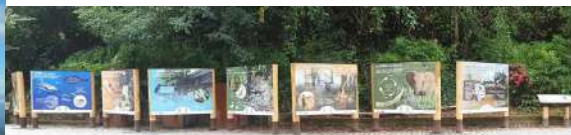
I pannelli della mostra "InSOStenibile per la Natura"

La mostra "InSOStenibile per la Natura", realizzata nel 2021 è presente all'interno del PNV e oggetto di varie attività educative, come la visita guidata "SOS Natura"