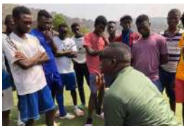
i giocatori di calcio incontrano le persone che si occupano di conservazione