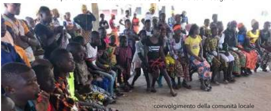
coinvolgimento della comunità locale