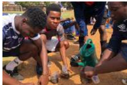
attività di conservation education: approfondimento e discussione di gruppo sugli scimpanzé e semina per una futura messa a dimora delle piante nell'area di Tacugama