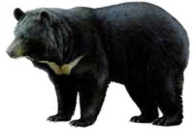
Orso nero asiatico