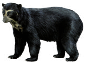
Orso dagli occhiali (orso andino)